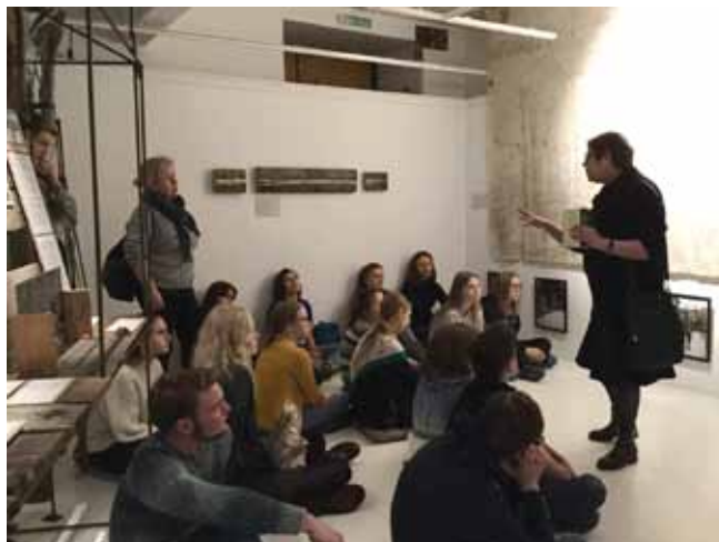
Занятие студийцев Российской академии художеств. Обсуждают события, документы и метафоры.

Мы уверены, что молчание о трудном времени пережитых всем обществом исторических испытаний умножает наше непонимание себя и друг друга. Без спокойного разговора об агрессии как природном, присущем всем людям свойстве, и регулировании агрессии культурными механизмами мы продолжаем транслировать неуважение к человеку и калечащие нас модели поведения. В финальной витрине есть цитата из документа 1930 года о прибытии этапа заключенных. Это вневременное описание, оно подходит к любым неравновесным ситуациям модели «правый — виноватый». И после этого легко дается обсуждение ситуаций, в которых нам надо учиться